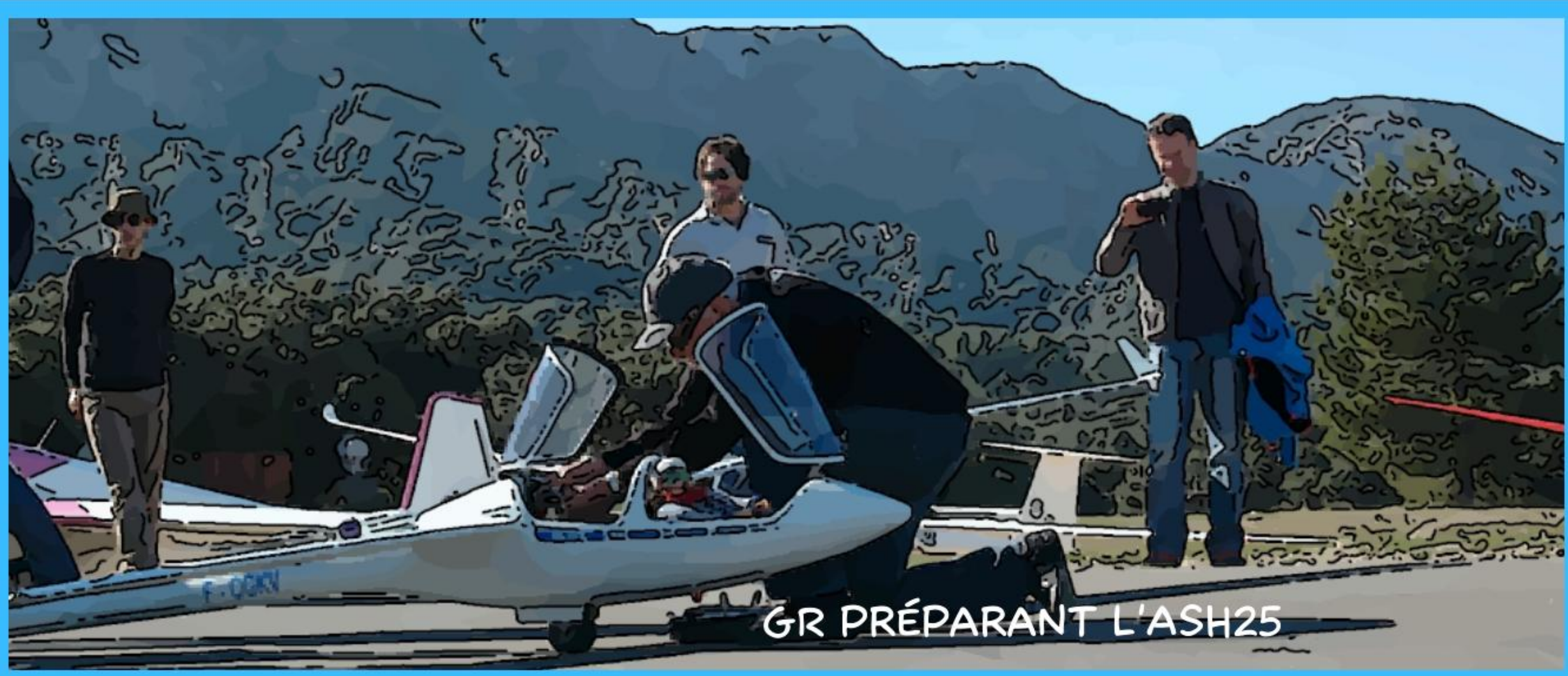
GR PRÉPARANT L'ASH25