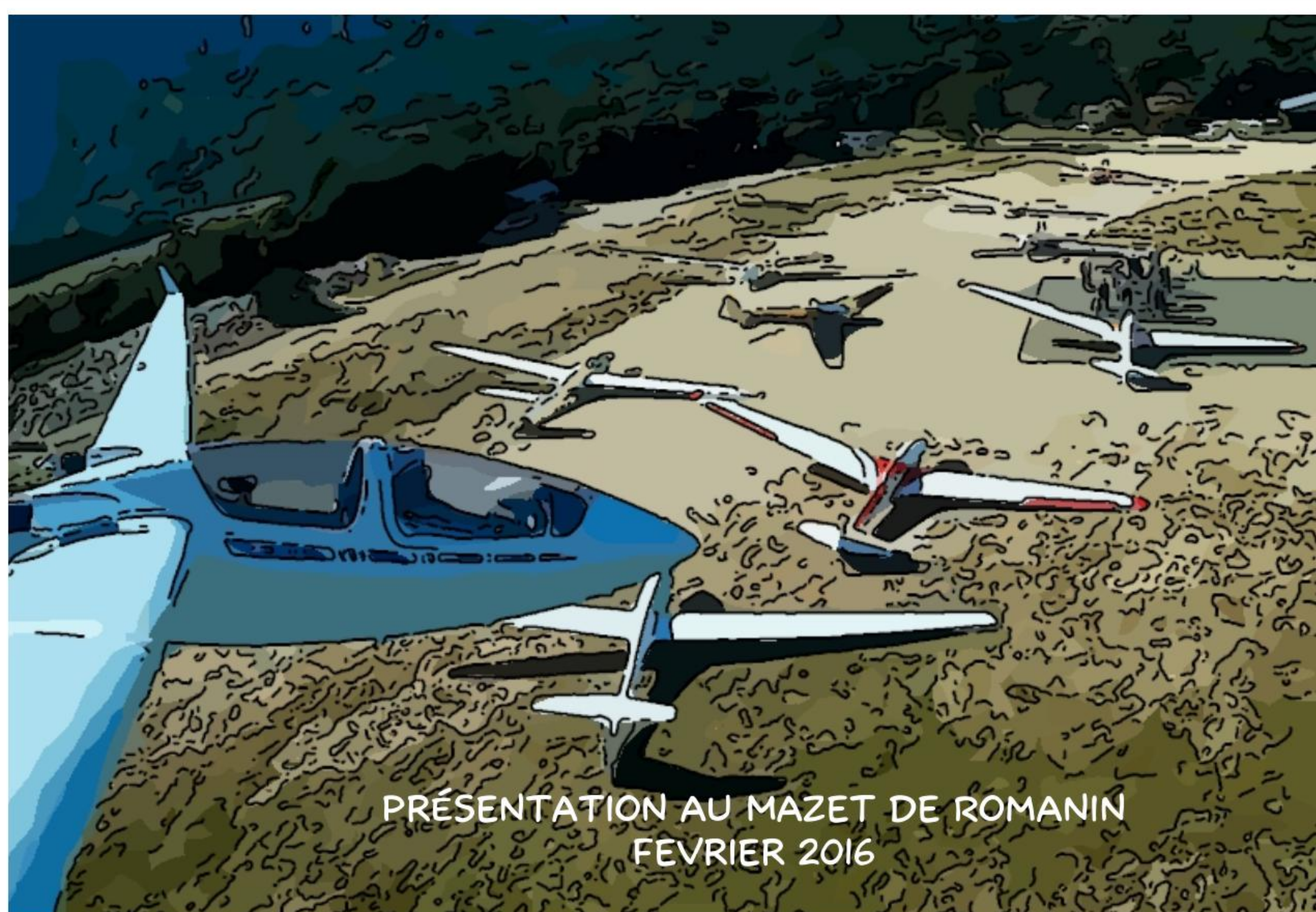
PRÉSENTATION AU MAZET DE ROMANIN FEVRIER 2016