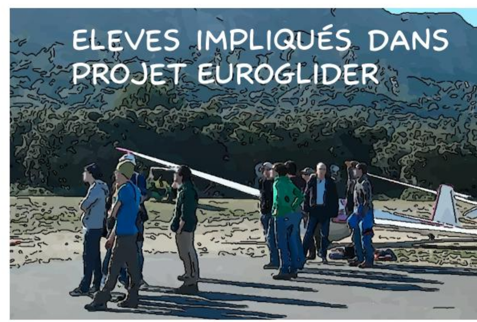
ELEVES IMPLIQUÉS DANS PROJET EUROGLIDER