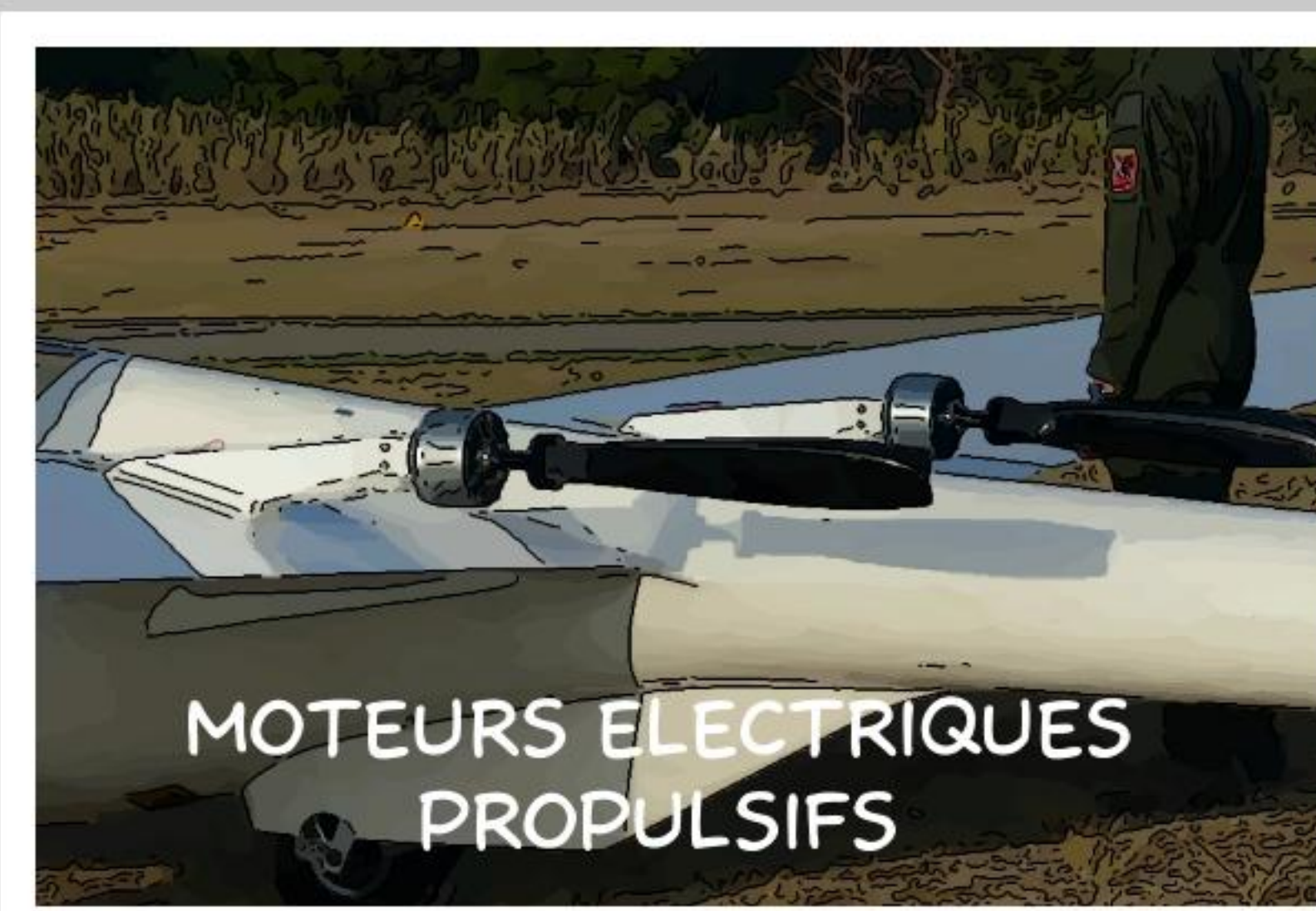
MOTEURS ELECTRIQUES PROPULSIFS