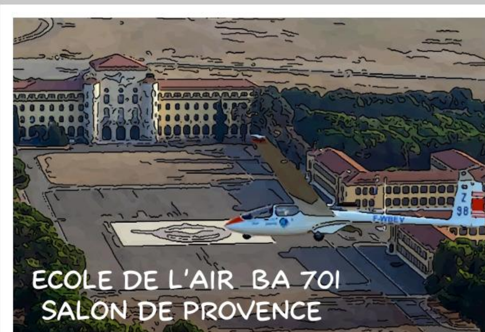
ECOLE DE L'AIR BA 701 SALON DE PROVENCE