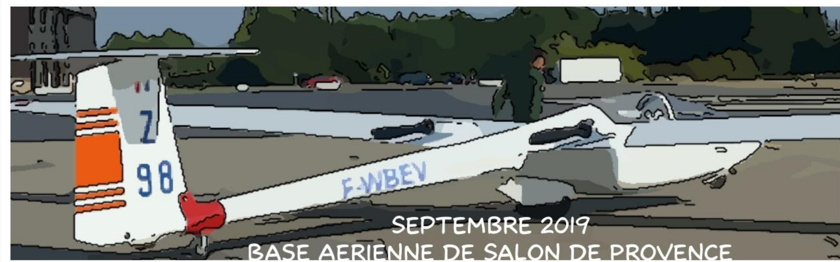
SEPTEMBRE 2019 BASE AERIENNE DE SALON DE PROVENCE